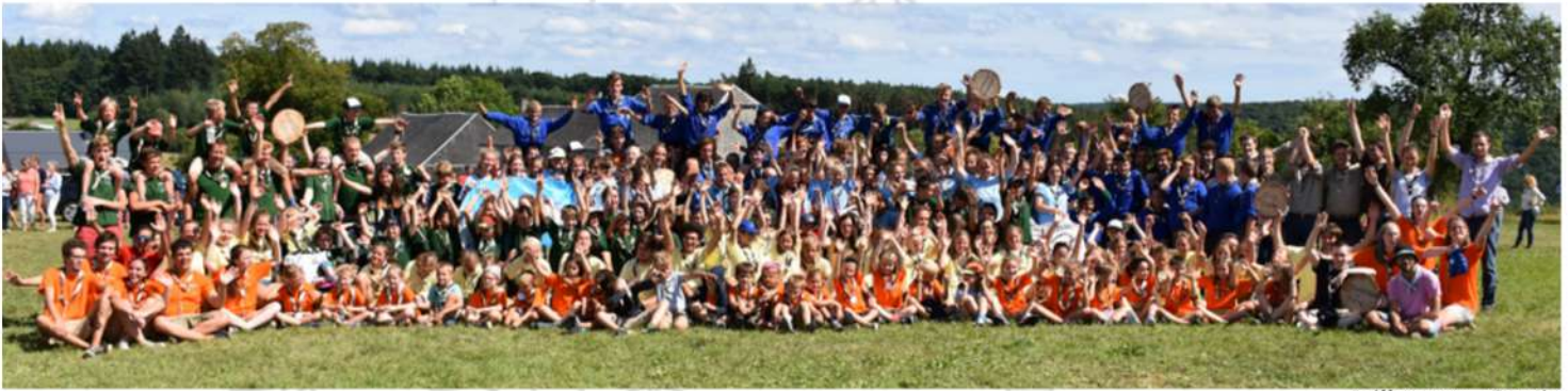
Juillet 2017 - Couvin